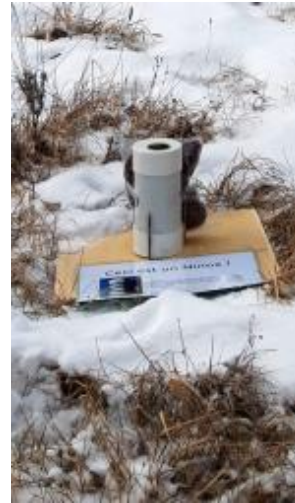
Trop près du sol avec un risque que l'humidité pénètre dans le boîtier