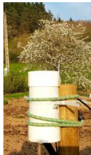
Ninox loin de tout obstacle qui pourrait obstruer son champ