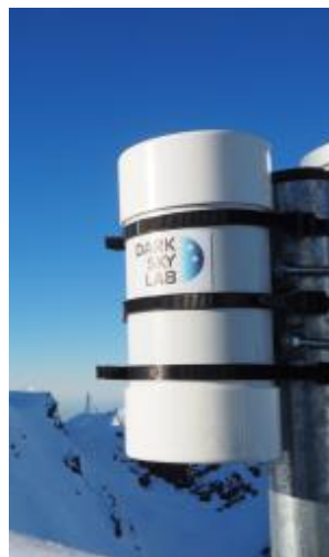
Ninox positionné en haut du piquet de fixation