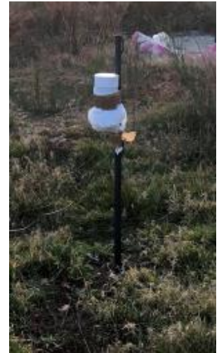
Champ du Ninox partiellement obstrué par le haut du piquet

Voici quelques exemples de systèmes Ninox correctement installés :