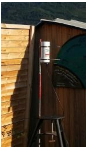
Ninox suffisamment surélevé pour ne pas être gêné par le toit

Voici quelques exemples de systèmes Ninox correctement installés :