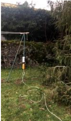
Trop près d'un arbre et champ obstrué en partie par le piquet

Le Ninox doit être placé à bonne distance d'obstacles hauts éventuels tels que des murs ou des arbres qui pourraient obstruer son champ de vision. Il est recommandé en particulier de ne pas placer le système Ninox à proximité d'une route (sauf pour des projets spécifiques) ou des fenêtres d'une habitation. Voici quelques exemples de Ninox incorrectement installés :