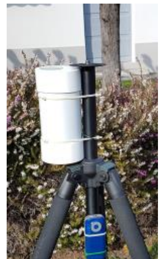
Champ du Ninox non obstrué par la collerette du pied photo

Le tube SQM Ninox peut être fixé de diverses façons (utilisation d'un support de jumelle avec une bande élastique sur un pied photo, utilisation des colliers métallique livrés avec le système, colliers de serrage plastiques, etc.). L'important est que la fixation soit solide et le support bien stable de manière à résister à des vents violents. Le tube est étanche mais il est préférable de vérifier de temps en temps la propreté du hublot (utiliser un chiffon microfibre doux et un produit spécifique pour optique).