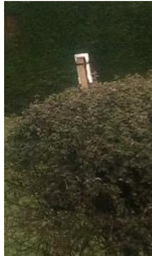
Système Ninox positionné de manière non verticale