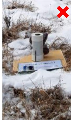
Trop près du sol avec un risque que l'humidité pénètre dans le boîtier