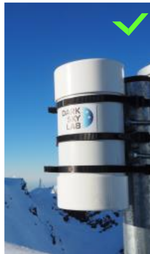
Ninox positionné en haut du piquet de fixation